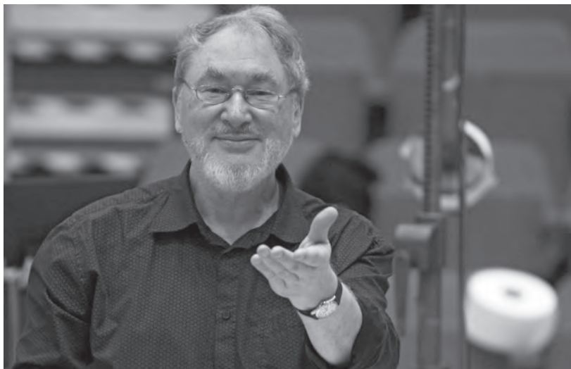
Heinz Karl Gruber

Im Hintergrund des Pandämoniums, hinter einer jeden noch so unschuldigen Szene lauert Frankenstein (daher die Ausrufezeichen Frankenstein!! in Grubers Komposition). Ständig ist der Orchesterklang gefährdet, wird durch den Griff in den Schrank der Spielzeuginstrumente verfremdet und um eine unheimliche Tiefenschicht bereichert – etwa wenn die heulenden Plastikschläuche zwar ihre motivisch-harmonische Funktion haben, diesen Kontext aber sogleich durchbrechen.